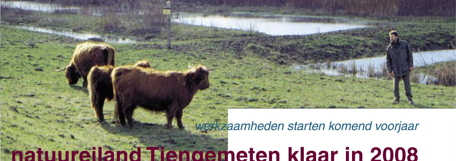
werkzaamheden starten komend voorjaar